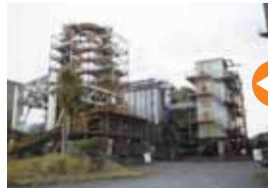
▲扇島焼却炉工場。焼却灰は再利用されます