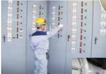
▲扇島中央事務所の空調制御室とボイラ