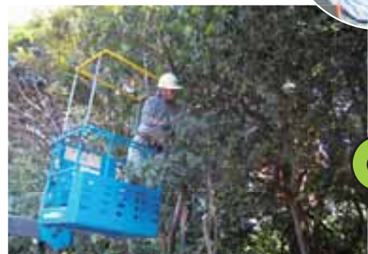
▲扇島東西一号道路沿いの高所剪定作業

扇島中央事務所前面のふれあいの池。HGS京浜事業部や京浜緑化部の手で日々、ビオトープとして美しく保たれている。今年もそろそろ渡り鳥の来る頃だ。