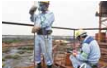
▲高所での大気測定