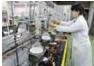
▲水質検査。扇島エネルギーセンター内の分析室で