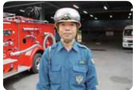
▲扇島防災センター前で