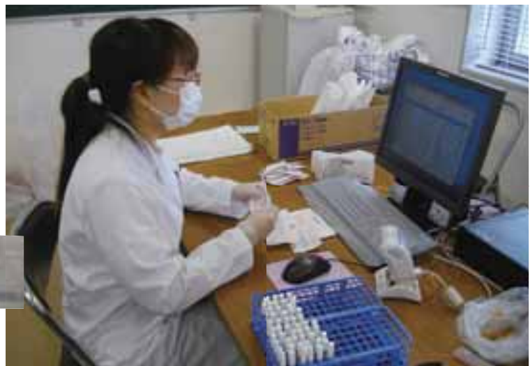
▲検体（画面手前のラック）と提出者が瞬時に照合できる。