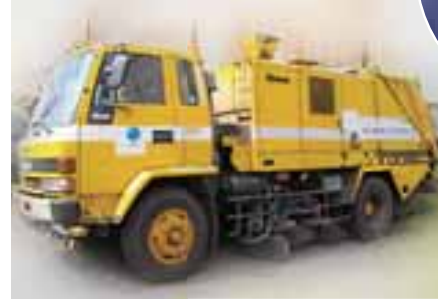
▲ボディ下に回転ワッシャーを内蔵したロードスイーパー