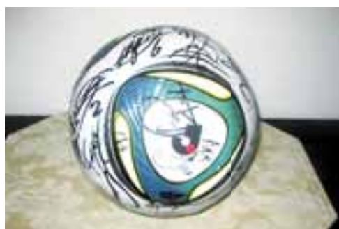
▲茶谷事業部長がゲットした話題のジェフ全選手・監督のサイン入りボール