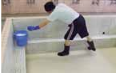
▲入念に入念に……。製鉄部の浴室清掃