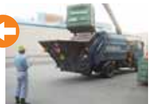
▲ごみ運搬車(資源回収チーム)