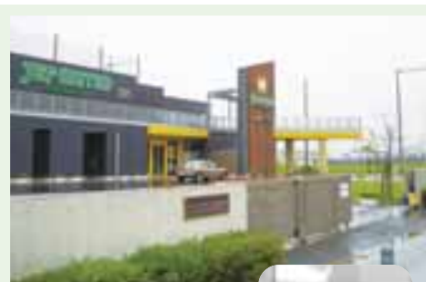
▲クラブハウスのエントランス。右奥がナイター照明付き練習グラウンド

ジェフのクラブハウスを取材しました。良質芝のサッカーコート2面が隣接するJリーグ屈指の施設だそうです。食品センターでは、このなかの食堂運営を受託、選手に《憩いのひととき》を提供しています。