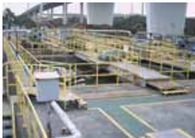
▲首都高湾岸道路下に広がる扇島生活排水処理場