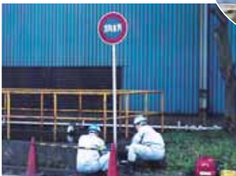
▲台風で倒れた消防用水槽の標識を修復中