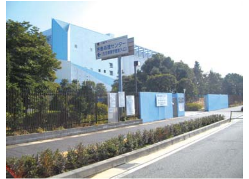
▲緑に囲まれた川崎市浮島処理センター

一般家庭から排出されるごみ類のなかで、タテ、ヨコ、高さ、径（円形のもの）のうち、一番長いところを図って、30cm以上の金属製品、50cm以上の家具類を言います。それぞれに回収費が必要。なお家電4品種（エアコン・テレビ・冷蔵庫・洗濯機）や、パソコン、自動二輪車などは別途定める廃棄基準に拠ります。