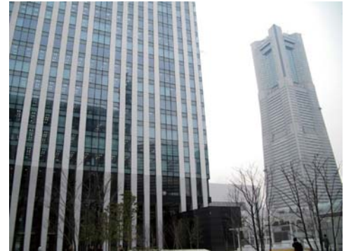
▲みなとみらいセンタービルの雄姿。右は横浜ランドマークタワー