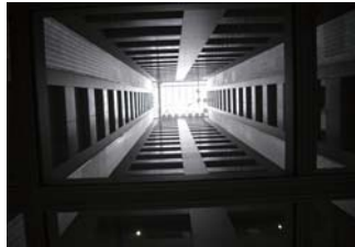
▲省エネ機能を秘めた大胆な吹き抜け構造

このたびビル管理部では、横浜市・みなとみらい地区の「みなとみらいセンタービル」内のオフィスビル共用部および専用部の日常・定期清掃業務を受注しました。同ビルは地上21階、地下2階、塔屋1階構造で昨年5月に竣工し、現在テナント入居中の最新鋭ビル。エントランス前の広大なリビングガーデンによるヒートアイランド防止や中央の吹き抜けを活用した太陽光自動追尾システムによる照明電力の削減技術導入などで、横浜市建築物環境配慮制度（CASBEE 横浜）の最高ランクSを取得しています。今回の物件は、ビルメンテナンス業界大手・株式会社ビル代行様からの初めての業務委託であり、CASBEEに対応した清掃資機材の配備や運営方法など、当社の近代化対応を問われる試金石ともなります。